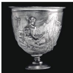
Anschaulich: Neil MacGregors Weltgeschichte in Objekten. Seite 56