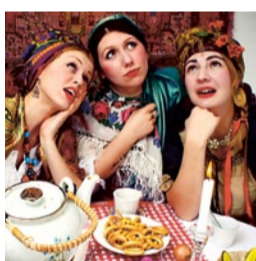
Wodka, Mayonnaise, Ecstasy: Genusskultur in Russland. Seite 48