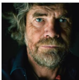
Zu Besuch bei Reinhold Messner. Seite 36