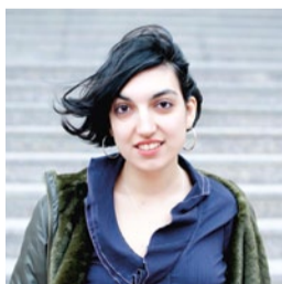
Elif Batuman: Ein Campus-Roman mit Tolstoj. Seite 59